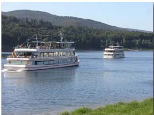
Unsere Fahrt mit der "Stern von Waldeck"

Bei wunderschönem warmen Wetter und Sonnenschein beschrifteten wir den Edersee der ziemlich wenig Wasser führte. Die Fahrt führte uns durch den östlichen Teil, zu einigen Anlegern und zur Sperrmauer des Edersees.