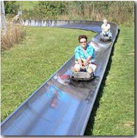
Die Rodler donnern ins Tal