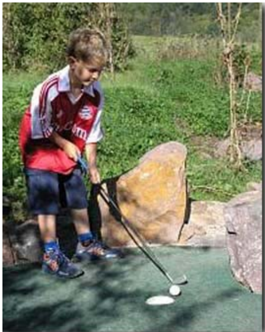
Auch die Jüngsten hatten ihren Spaß

Man kann natürlich auch spazieren gehen.