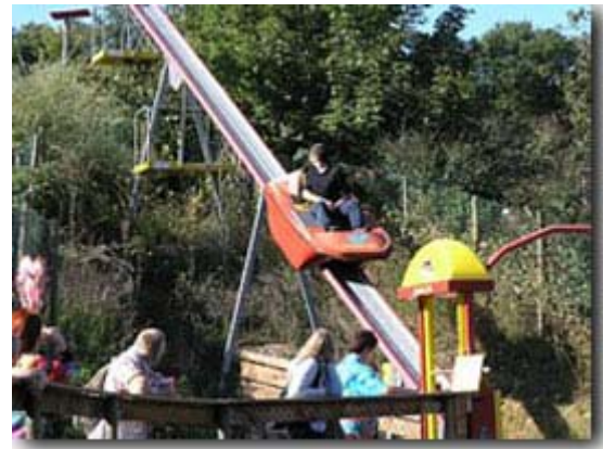
Ob das gut geht?

Im Freien und unter Bäumen haben wir dann ganz ausgezeichnet gespeist.