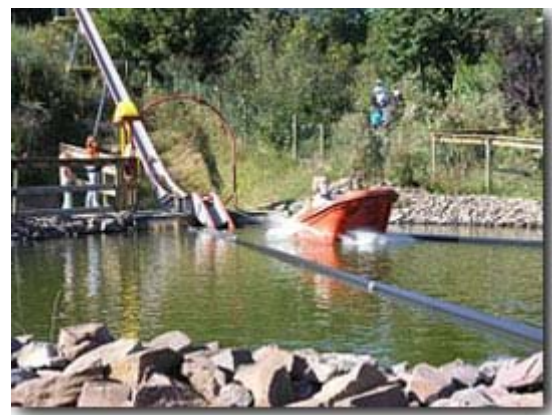
Da kommt Freude auf

Die Rodelbahn wurde eifrigst und auch mehrmals genutzt, denn es hat viel Spaß gemacht dort herunter zu donnern, besonders wenn freie Bahn war.