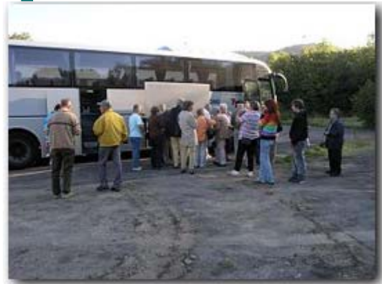
7 Uhr, es kann losgehen.

40 tapfere Personen stiegen um 7 00 Uhr morgens auf dem Parkplatz am Kreiskrankenhaus in Groß-Gerau in den Bus. Die Fahrt ging über die Autobahn und Landstrassen an Bad Wildungen vorbei zum Schiffsanleger auf der Rückseite des Sees.